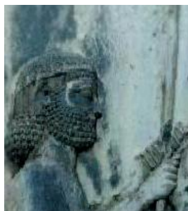
(و) روش پیشنهادی در این مقاله