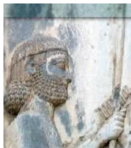
(ه) روش پیشنهادی در این مقاله بدون مرحله آمیختن با تبدیل موجک

شکل ۴: بزرگ شده‌ی قسمتی از نتیجه‌ی اجرای شیوه‌های مختلف برای افزایش وضوح شکل ۲(آ). دقیق‌تر بودن مدل در شیوه‌ی پیشنهادی نسبت به شیوه‌ی ذکر شده در [۴] که فاقد ثبت تصویر مبتنی بر ناحیه است از مقایسه‌ی قسمت بالایی نیزه در شکل‌های (و) و (د) مشخص است.