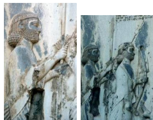
شکل ۲: (آ) تصویر با وضوح بالا و (ب) تصویر آموزش (ج) نتیجه نهایی در SNR=90dB

شکل ۲: نتیجه نهایی افزایش وضوح تصویر ورودی (ا) با استفاده از تصویر (ب) و با روش پیشنهادی در شکل ۱ که دقیقتر نمودن ثبت تصویر در آن با الگوریتم ۲ و هم‌رنگ نمودن بدون درز با شیوهی ارائه شده در [۷] انجام شده است.