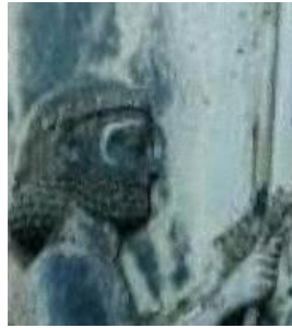
(ج) روش ارائه شده در [۱۰]