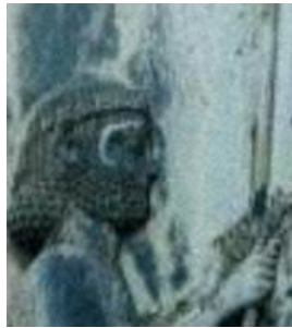
(ب) روش بزرگنمایی Bicubic