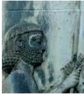
(د) روش ارائه شده در [۴]