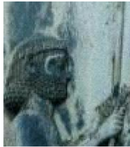
(آ) روش بزرگنمایی Replication